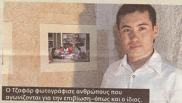
Ο Τζαφάρ φωτογράφησε ανθρώπους που αγωνίζονται για την επιβίωση—όπως και ο ίδιος.